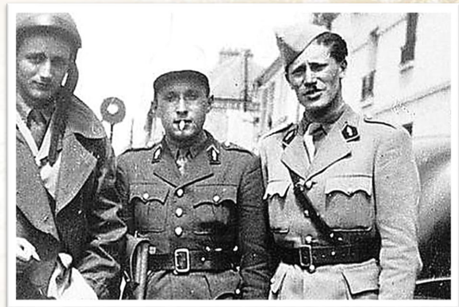
Морис Дрюон на фронте, крайний справа.