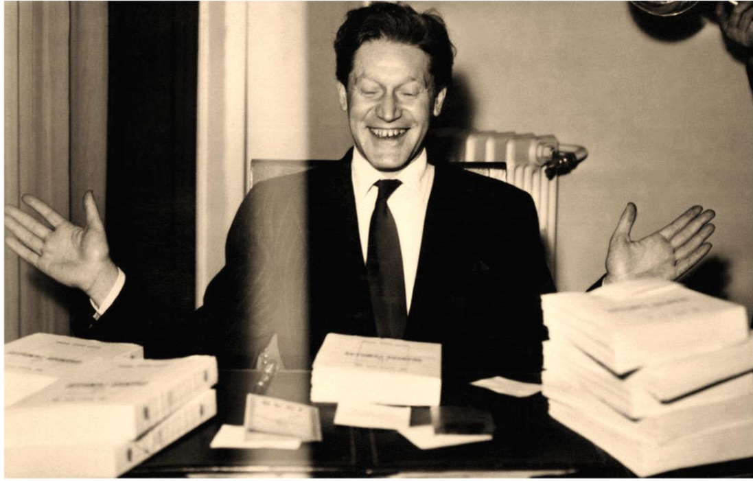
Моррис Дрюон радуется первому изданию романа «Железный король».

У Морриса рано проявилась склонность к литературному творчеству, первый успех пришел еще в школе, когда Дрюон занял 2 место в национальном конкурсе сочинителей, написав комментарий к изречению основателя автоконцерна Луи Рено. В 18 лет юноша начал публиковаться в специализированных журналах. В 1938 году вышел сборник новелл «Огненная туча». Последние годы Второй мировой Моррис провел в Германии и Эльзасе в качестве журналиста, а в 1946 году молодой человек решил полностью посвятить себя литературе. В это время опубликована повесть «Последняя бригада», в которой автор поделился переживаниями по поводу войны и тем, какой шок испытала нация, когда выяснилось, что государство не станет открыто противостоять нацизму.