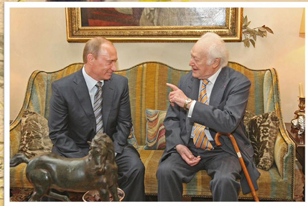
Владимир Путин и Морис Дрюон в Париже, 2008.

Вероятно, итогом этих бесед стали статьи и выступления писателя, в которых он отстаивал современный российский курс.