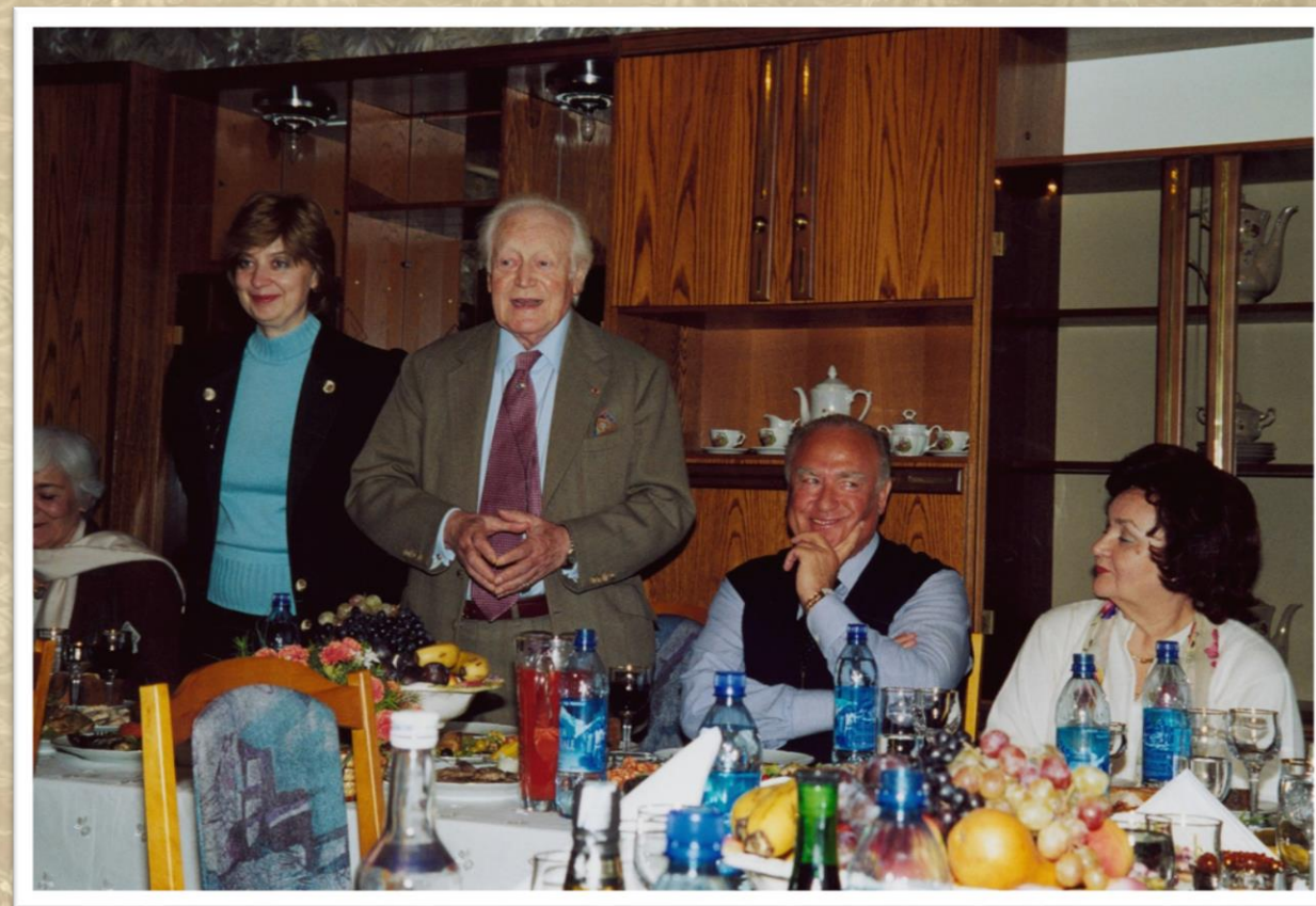
Морис Дрюон (стоит) и Виктор Черномырдин.