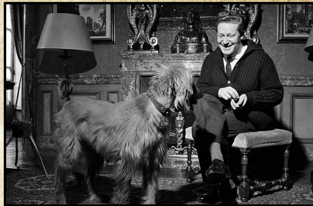
Морис в своем поместье.

К середине 50-х Морис завершил работу над циклом «Конец людей», в котором описал реалистичную историю и нравы буржуазной Франции начала и середины прошлого столетия на примере нескольких поколений знатных французских семейств. Первая часть «Сильные мира сего» принесла автору высшую литературную награду Франции – Гонкуровскую премию. Со временем Морис начинает пробовать себя в разнообразных жанрах: он работает над «мифологическим» романом об Александре Македонском и двухтомными «Мемуарами Зевса». Далее переключается на детскую литературу, затем приступает к написанию эссе об истории и французском языке.