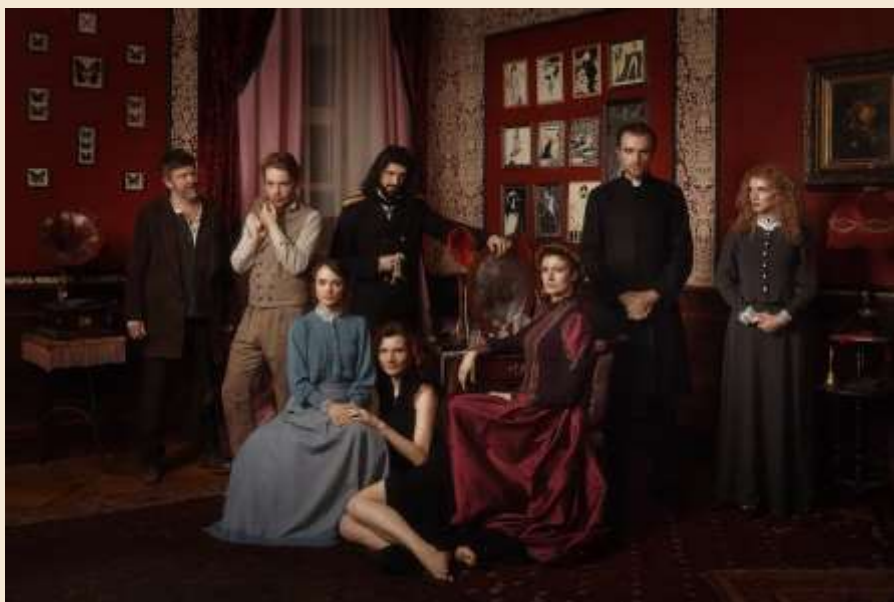
Рекламные фотографии шоу «Вернувшиеся»

«Чтобы иметь все основания для творчества, нужно, чтобы сама жизнь ваша была содержательна» — Генрик Ибсен.