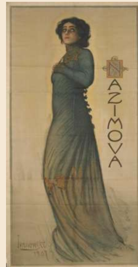
Алла Назимова в роли Гедды Габлер