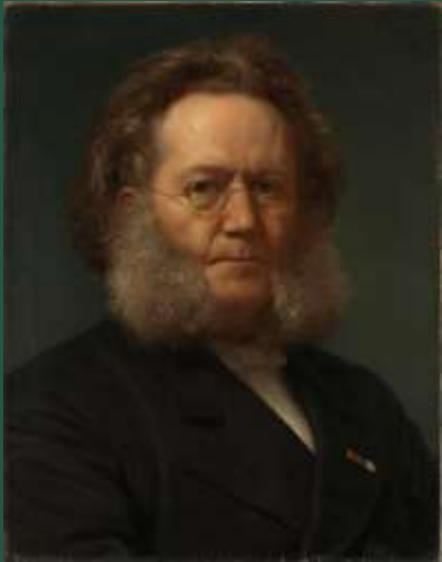
Портрет Генрика Ибсена Генрика Ольрика.

«Что посеешь в юности, то пожнешь в зрелости» — Генрик Ибсен.