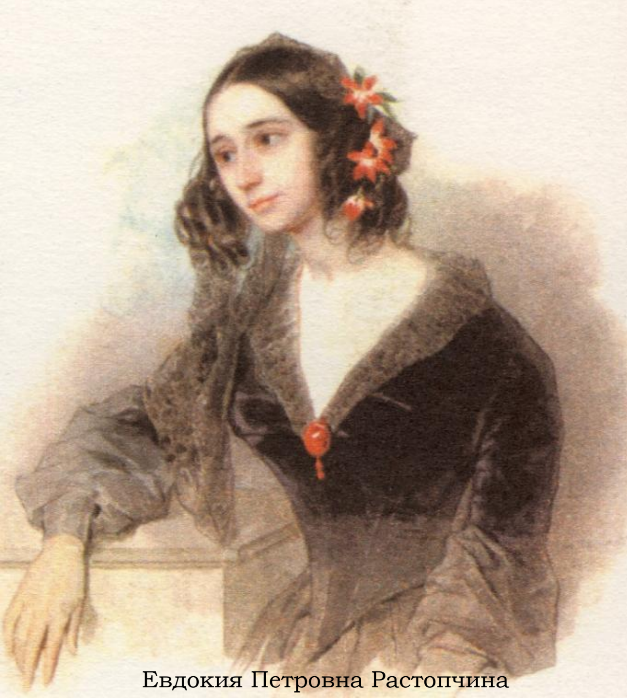
Евдокия Петровна Ростопчина

Творчество Владимира Федоровича периода 1830 – 1840-х годов наполнено мистицизмом, так как автор в тот период серьезно увлекался оккультными науками. О своих фантастических произведениях, сам Одоевский отзывался словами: «И фантастизм и анализ». «Алхимико-музыкально-философско-фантастическое сиятельство» — так в шутку называла князя известная поэтесса своего времени, графиня Евдокия Петровна Ростопчина (1811-1858), которой Одоевский писал свои знаменитые письма «о привидениях, суеверных страхах, обманах чувств, магии, кабалистике, алхимии и других таинственных науках», не публиковавшихся с 1844 года, когда вышло трехтомное первое собрание его сочинений.