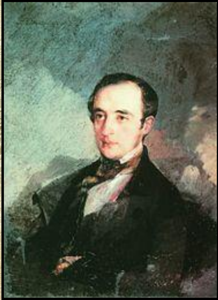
Предполагаемый портрет Одоевского кисти И. Макарова

Писать Одоевский начал еще во время обучения в пансионе. Дебютными стали публикации произведений «Разговор о том, как опасно быть тщеславным» и «Дни досад», размещенные на страницах журнала «Вестник Европы». Владимир дружил со многими декабристами и помогал им издавать альманах «Мнемозина». Когда восстание декабристов было подавлено, выпуск журнала запретили, а Одоевский сжег все документы, которые могли бы установить причастность его и друзей к выпуску издания.