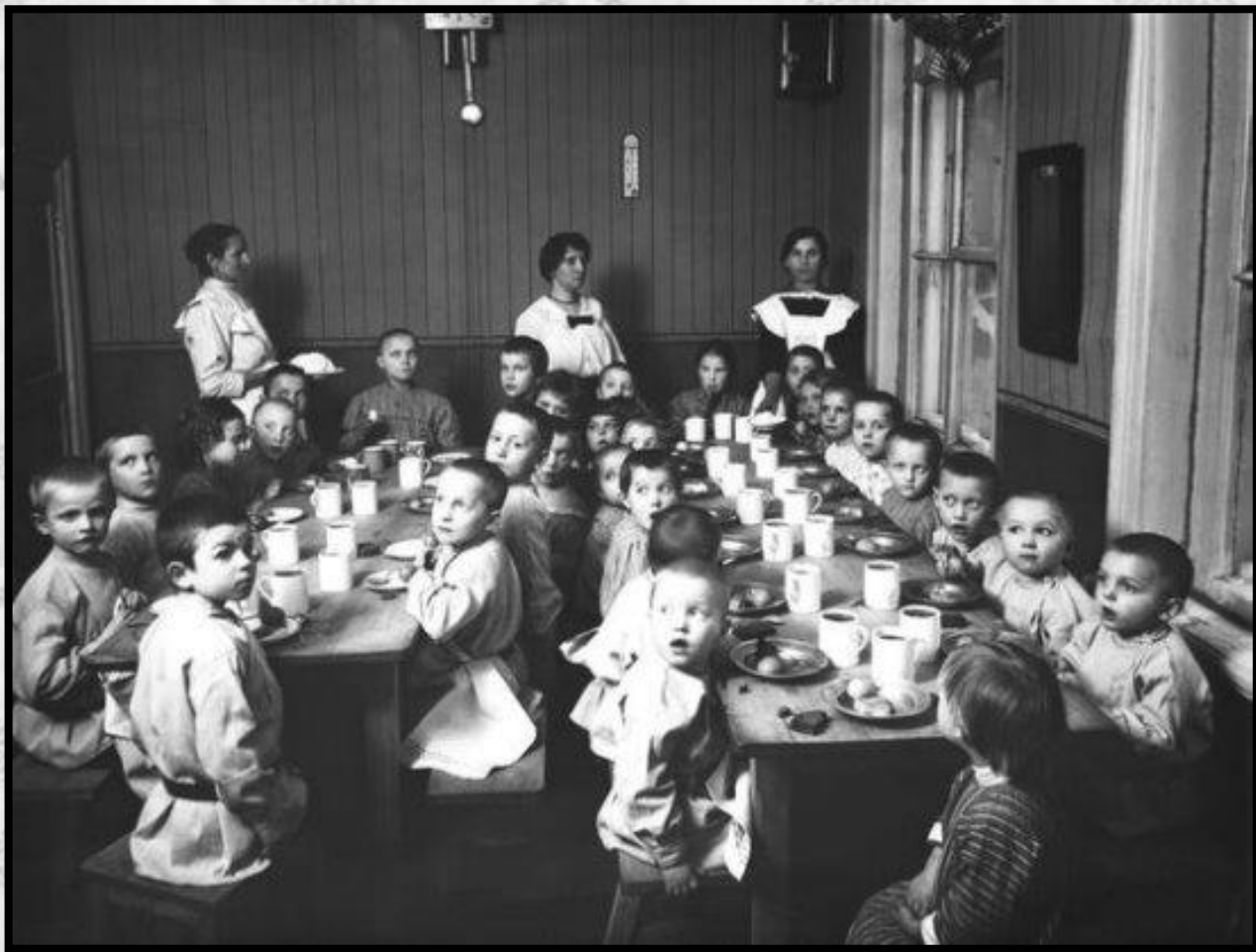
Детский приют. 1867 год

В начале 1860-х Владимир Федорович несколько отошел от литературного творчества, отдавая много времени благотворительности. Одоевский активно помогал сиротам, сотрудничал со многими благотворительными организациями и детскими приютами. Благодаря писателю была основана Максимилианова лечебница, а позже и Елизаветинская больница. В 1846-м при участии деятеля было открыто петербургское Общество посещения малоимущих. Также была известна его твердая общественная позиция, заключающаяся в критике крепостного права. Своих убеждений писатель придерживался до последних дней, даже несмотря на неприятие со стороны многих дворян.