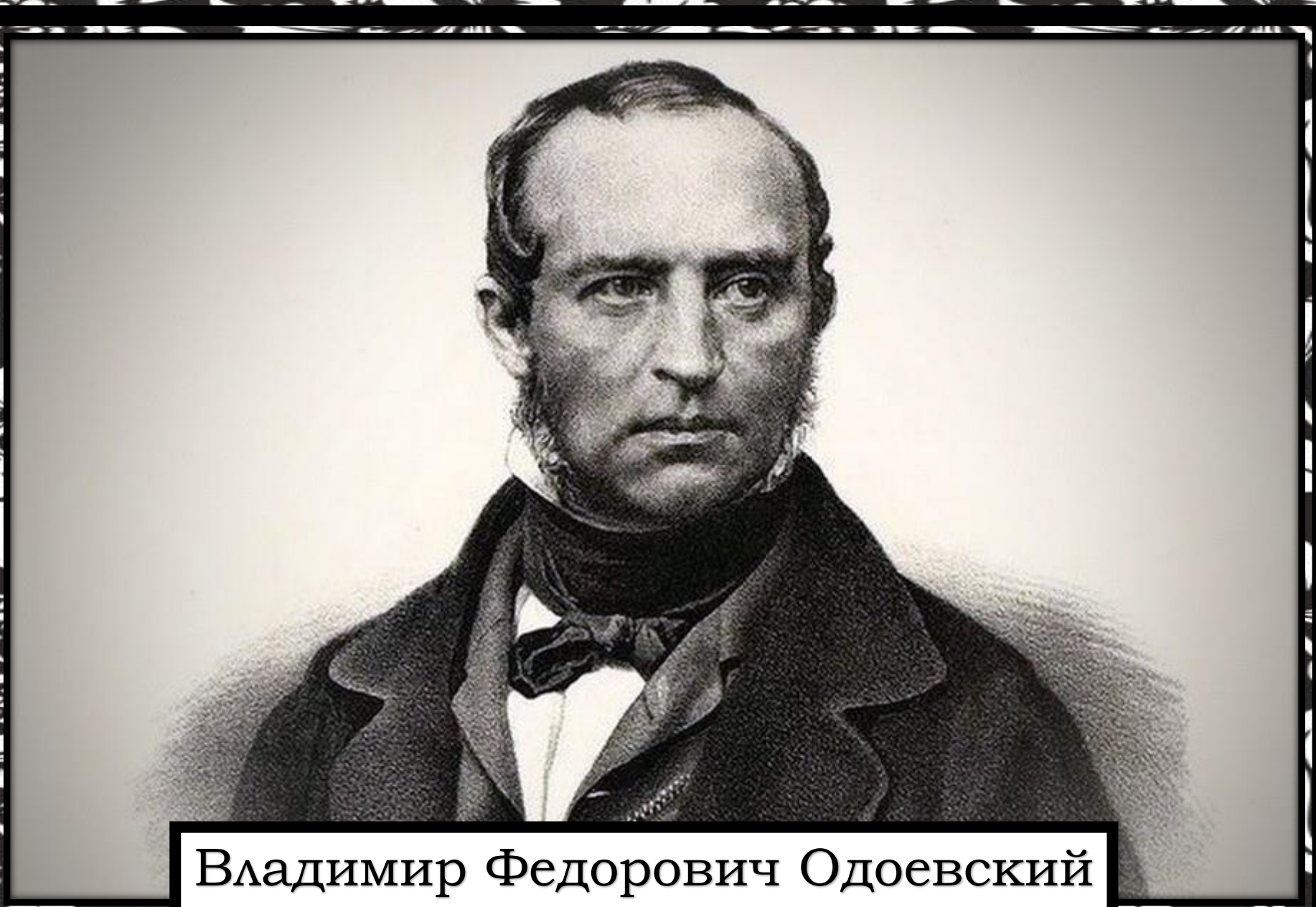
Владимир Федорович Одоевский 1803-1869