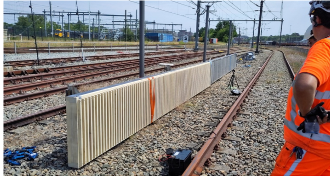
Рис.2 Испытания мини-звукового барьера

Независимая консалтинговая и инженерная фирма DGMR провела акустические измерения, чтобы предоставить неопровержимые доказательства эффективности SoundSafe Movable. (рис.2)