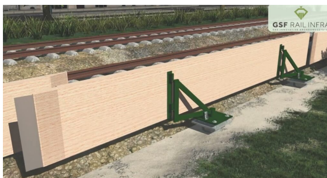
Рис.1 Передвижной противошумный барьер SoundSafe Movable

Благодаря инновационному фундаменту и новой вращающейся несущей конструкции, шумозащитные ограждения теперь можно размещать близко к источнику шума. Уникальная шарнирная несущая конструкция позволяет быстро убрать барьер для проведения работ по техническому обслуживанию и ремонту пути.