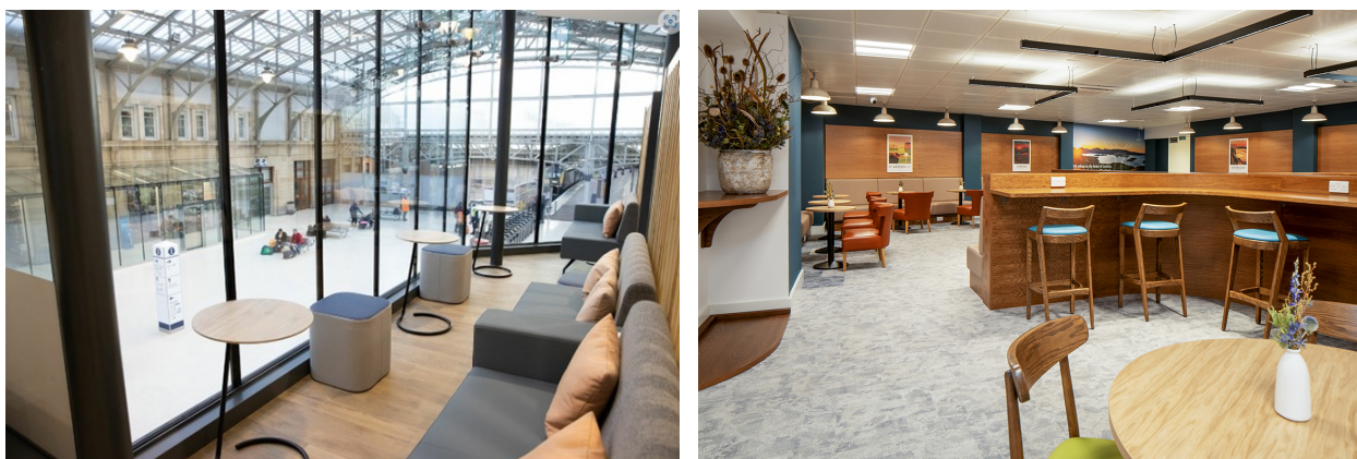
Рис. 1. Интерьер Euston Lounge

Euston Lounge представляет собой гостиную с мягкими диванами и уютными креслами (рис. 1). Дизайн интерьера салона в современном стиле, в котором доминируют приглушенные тона и натуральные материалы, мебель изготовлена из дерева.