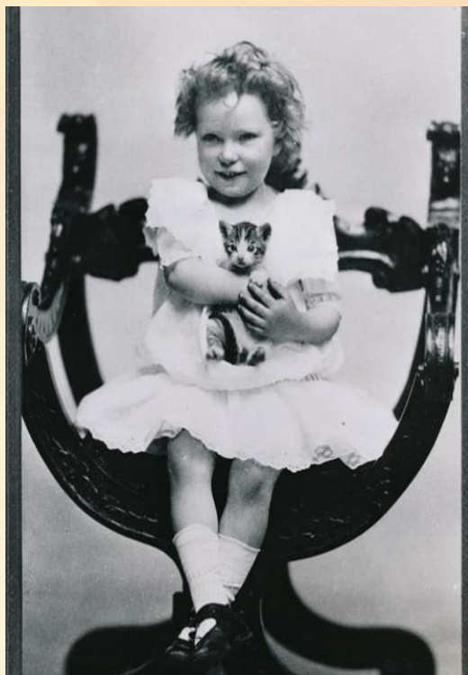
Маргарет Митчелл в детстве

Детство Маргарет прошло в атмосфере рассказов о событиях недавней эпохи, чему помогало и то, что отец её был председателем местного исторического общества.