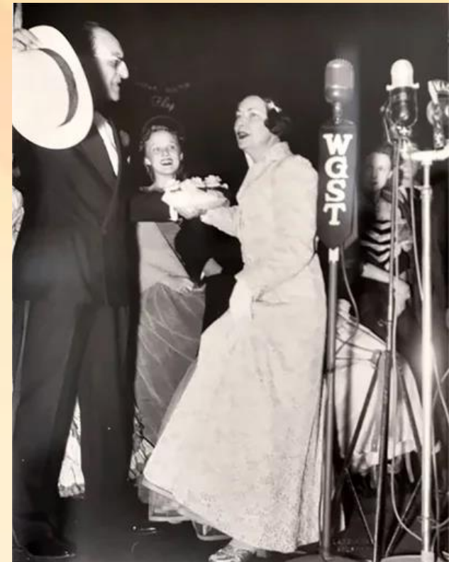
Маргарет Митчелл на премьере фильма

Примерно 30 тысяч человек собрались перед входом в кинотеатр, чтобы только взглянуть на кинозвезд, прибывших на премьеру.