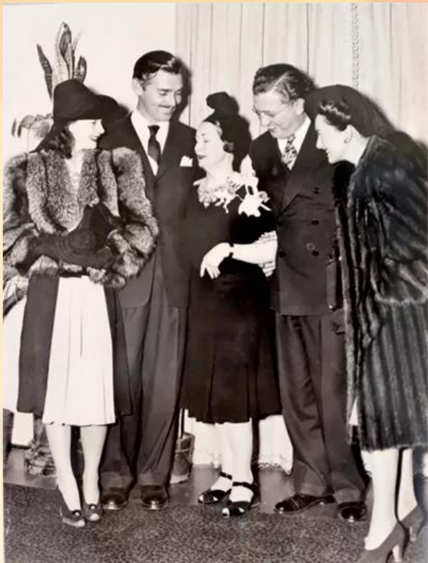
Вивьен Ли, Кларк Гейбл, Маргарет Митчелл, Дэвид Селзник и Оливия де Хэвилленд на предпремьерном приеме в Женском пресс-клубе