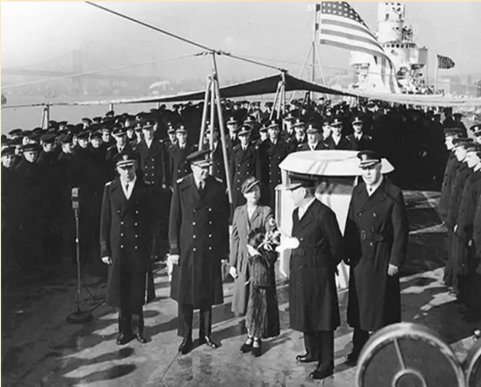
Митчелл на военном корабле 1941 г.

Многие ждали, что за первым романом последуют и другие, но Маргарет так больше ничего и не написала, из-за чего нередко возникали слухи о том, что на самом деле не она была автором произведения.