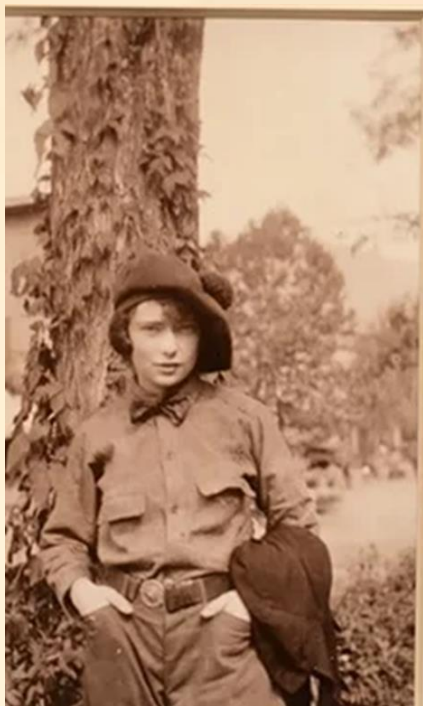
Маргарет Митчелл в юности

Маргарет начала писать рассказы еще в детском возрасте, сначала о животных, затем сказки и приключенческие истории. В возрасте 15 лет Маргарет Митчелл написала свой первый роман «Lost Laysen». Долгое время рукопись считалась утерянной, однако она сохранилась у друга писательницы и была обнаружена в 1994 году. В 1996 роман был опубликован и стал бестселлером.