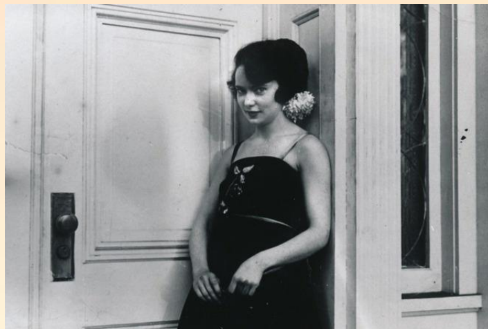
Маргарет Митчелл в молодости