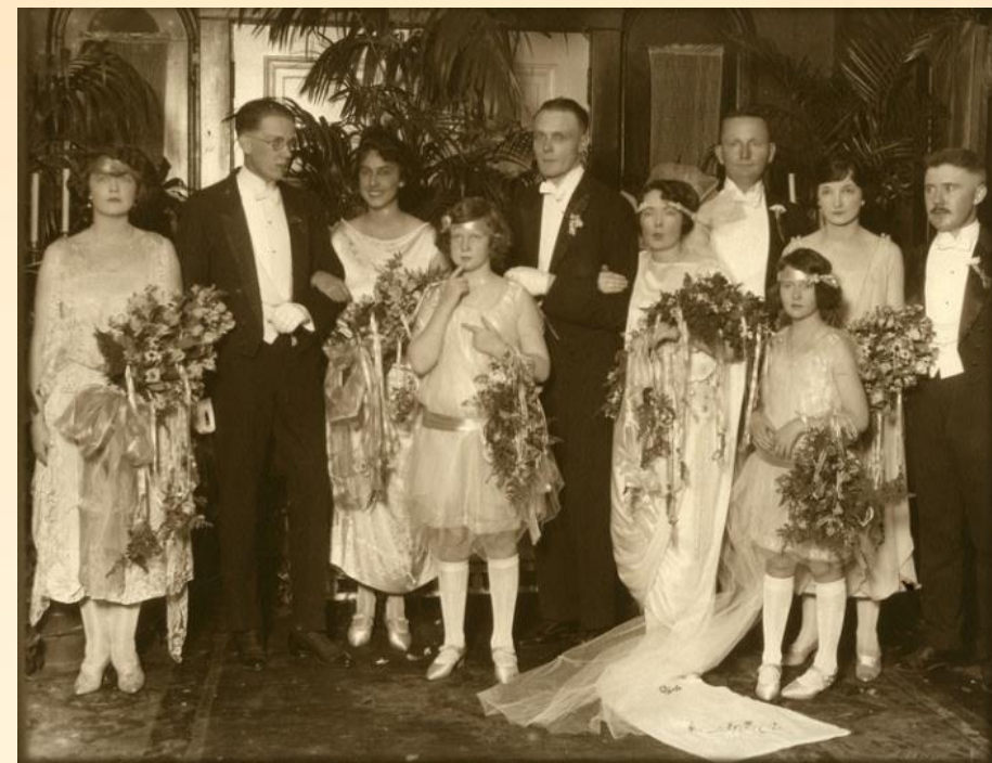
Свадьба Маргарет Митчелл и Берриена Киннарда Апшоу

Семейная жизнь виделась Маргарет в виде череды развлечений: вечеринок, приёмов, поездок на лошадях. Оба супруга с детства обожали конный спорт.